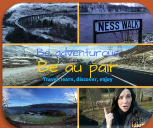
Ester – larga estancia

Que lo hagan, que se tiren a la piscina y aunque a lo mejor esté vacía cuando llegas, no te rindas que se llenará sola. Conocerás a gente, aprenderás otra cultura (que en mi caso aunque fueran europeos, nada que ver tiene un escocés con un español) y si tienes que conducir por "el lado contrario", hazlo! Cuando seas mayor te acordarás y estarás orgulloso de ti mismo/a.